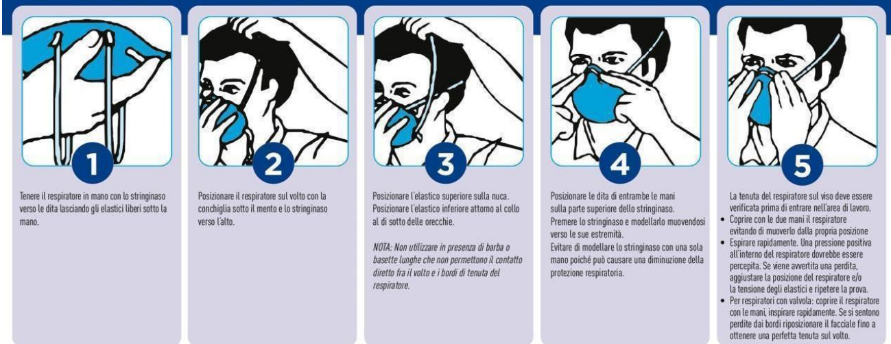
Figura 2: Procedura per indossare le mascherine

UNA VALIDA PROTEZIONE SI OTTIENE SOLO SE IL DISPOSITIVO È INDOSSATO CORRETTAMENTE. SEGUIRE ATTENTAMENTE LE MODALITÀ D'INDOSSAMENTO E VERIFICARE LA TENUTA AL VOLTO DEL DISPOSITIVO COME ILLUSTRATO.