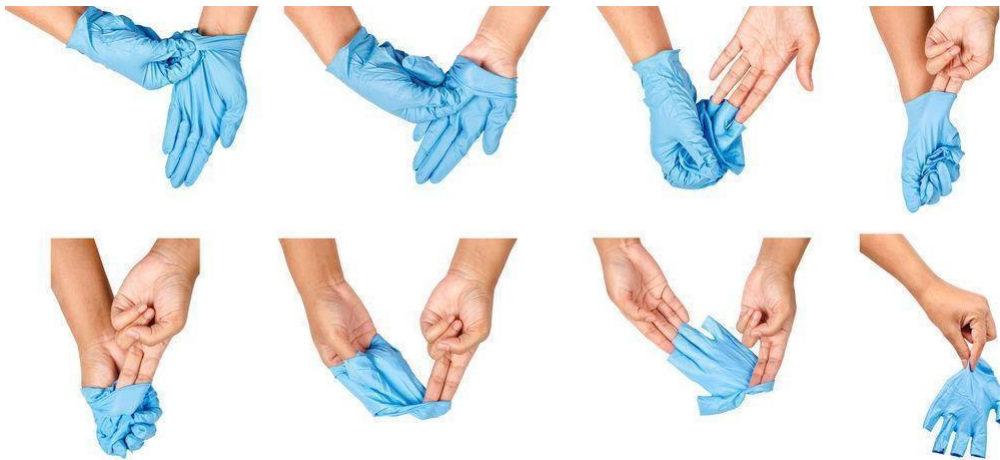
Figura 1: Procedura per tirare via i quanti monouso