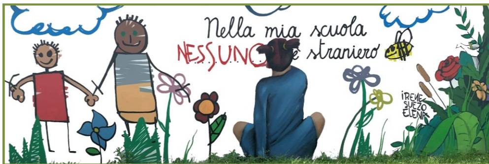
Particolare del murale realizzato nella scuola Casa del Sole, in occasione della Giornata Internazionale sui diritti dell'infanzia e dell'adolescenza, novembre 2017

Per un'esposizione completa delle informazioni sulle modalità del ricorso e per l'assistenza legale, è possibile rivolgersi ai vari sportelli immigrazione gratuiti presenti a Milano 6 .